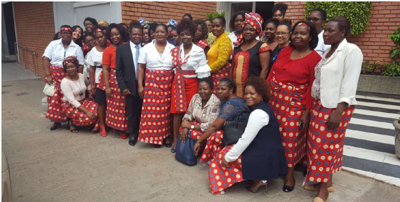
Mulheres do MEF, Direcções Provinciais da Economia e Finanças e Instituições Tuteladas celebram o dia da Mulher

O Ministério da Economia e Finanças enalteceu, por ocasião do 7 de Abril, a valiosa contribuição da mulher moçambicana, particularmente das suas funcionárias, na luta para a erradicação da pobreza e desenvolvimento económico e social do País.