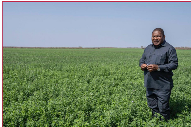
Presidente da República, Filipe Nyusi, visitando um projecto agrícola em Massingir, província de Gaza

• Como deve ser optimizada a tributação local a