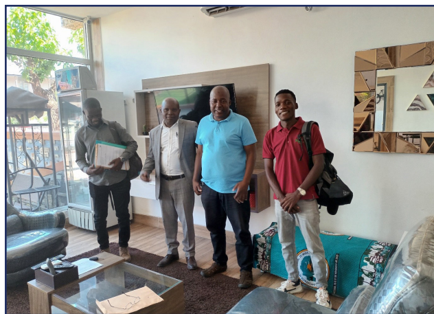
Encontro com o Presidente do Conselho Empresarial da Zambézia (CEPZ) e técnicos de recolha de informação junto de Agregadores da Zambézia

Tendo em vista o desenho de uma plataforma mais ajustada à realidade do Sector Agrário da Província da Zambézia, procedeu-se à recolha de informações diversas junto de potenciais agregadores, com o apoio do Conselho Empresarial da Zambézia (CEPZ-Zambézia).