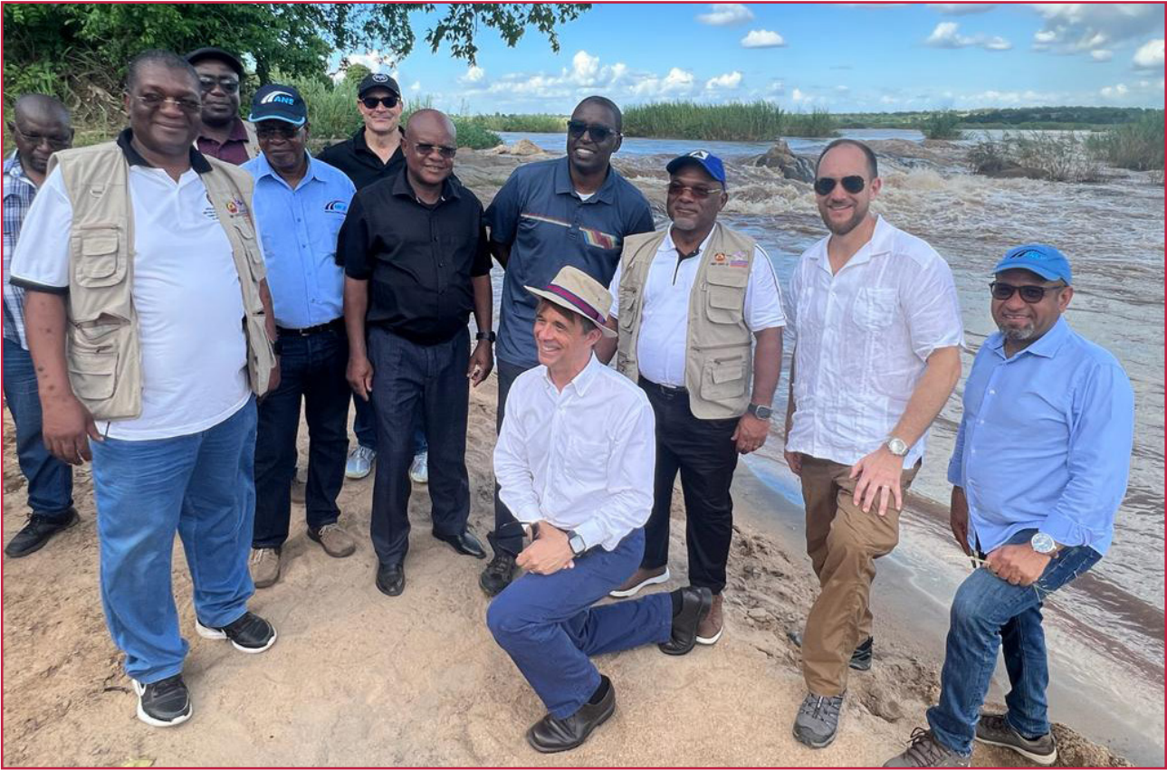
Comitiva em visita ao local por onde passará a nova ponte sobre o Rio Licungo, em Mocuba