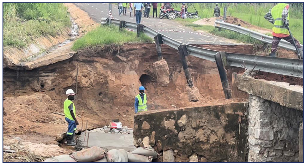
Os eventos extremos têm deitado abaixo, na Zambézia e noutros pontos do país, estradas e pontes!

elegível ao Segundo Compacto da agência norte-americana Millennium Challenge Corporation (MCC) em finais de 2019, cuja implementação será por um período de cinco anos. Para a preparação do Compacto foi estabelecido, em Maio de 2020, o Gabinete de Desenvolvimento do Compacto II (GDC-II), com tutela do Ministro da Economia e Finanças.