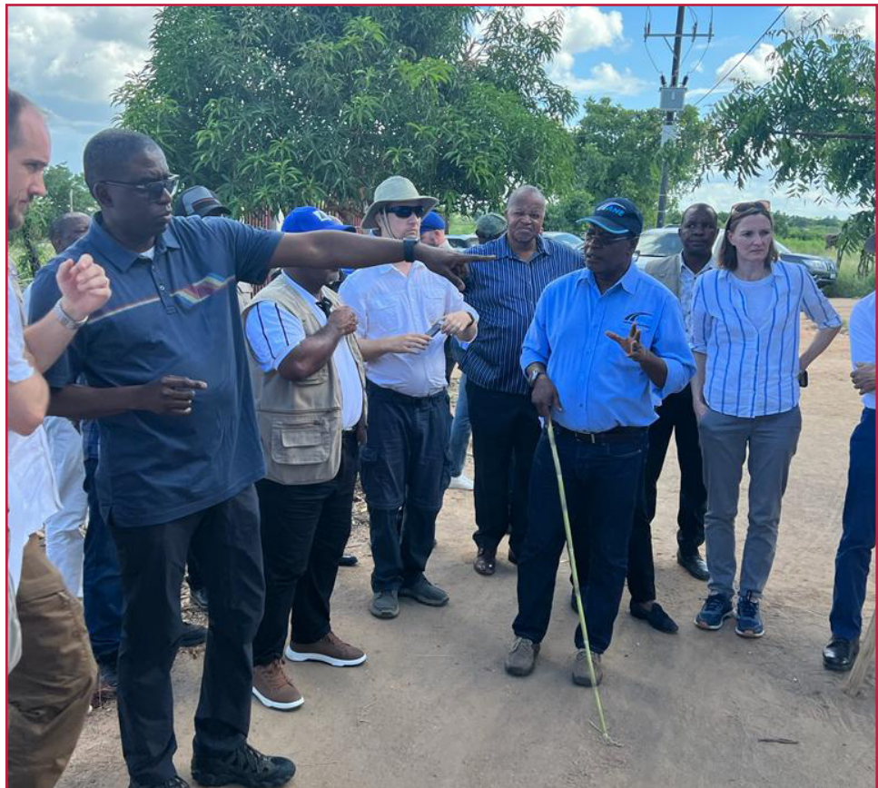
Bah com o dedo apontando para o futuro...

partes interessadas realizada em Mocuba, a 1 de Fevereiro último, Carlos Mesquita, Ministro das