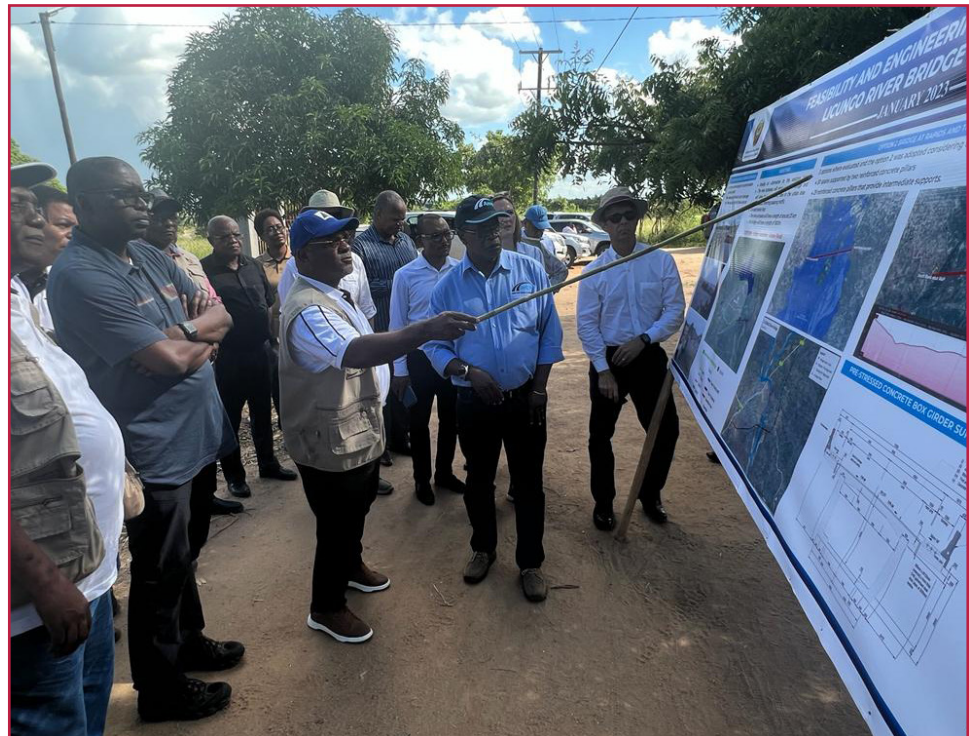
Ministro das Obras Públicas Habitação e Recursos Hídricos, Carlos Mesquita, explanando como será a nova ponte sobre o Rio Licungo e respectivo bypass, em Mocuba

encontro do género de que tomo parte e é bom saber que a agricultura continua uma das prioridades do Compacto II. Apesar de a agricultura ser tida como a base para o desenvolvimento de Moçambique, é lamentável que ainda existam relevantes segmentos do sector familiar a lavrar apenas com a enxada de cabo curto”, sublinhou.